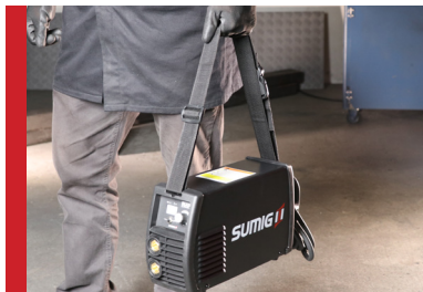
Equipamento Compacto e Versátil