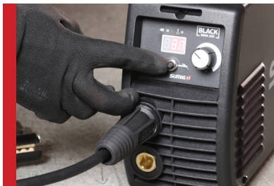
Painel de Fácil Operação

Black MMA 200 possui diversos recursos e características que proporcionam uma excelente soldabilidade.