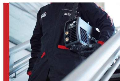
Flexível para diversos tipos de trabalho