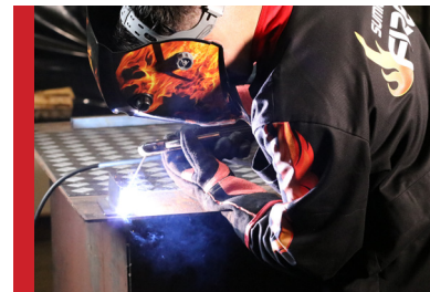
Excelente Estabilidade de Arco