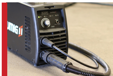
Cabos e Engates Precisos