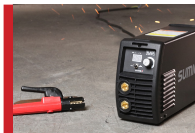
Baixo Consumo de Energia